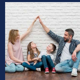
Prodotti e Servizi per la Famiglia